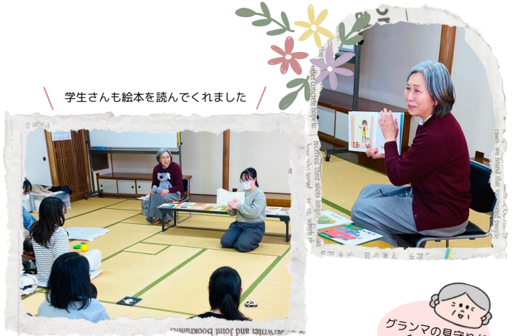
学生さんも絵本を読んでくれました