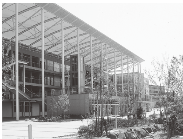
ひびきのキャンパス