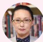
神原 ゆうこ 教授