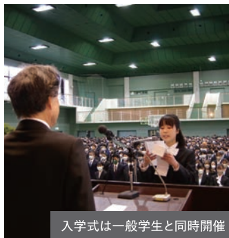
入学式は一般学生と同時開催