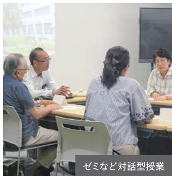
ゼミなど対話型授業