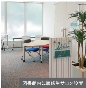
図書館内に履修生サロン設置