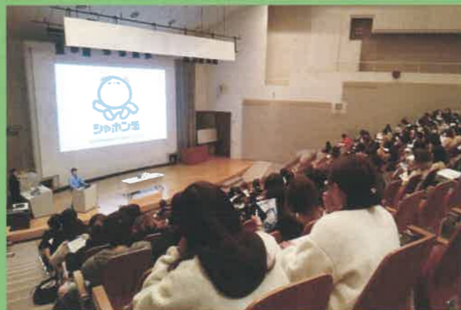
講義：環境都市としての北九州

本プログラムの「環境ESD」は、「環境」という視点からESDをとらえ、実践的にアプローチしていこうとするものです。公害克服を果たした北九州市の歴史的背景などとも関連し、持続可能な社会づくりに貢献する人材を育む環境教育を目指しています。