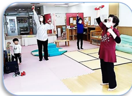
いち♪ にい♪ いち♪ にい♪